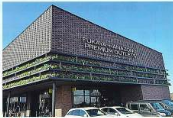
ふかや花園プレミアム・アウトレット