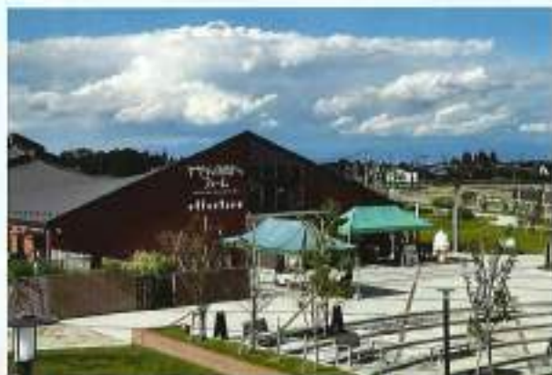
ヤサイな仲間たちファーム