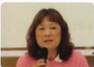
住伯研修委員長挨拶