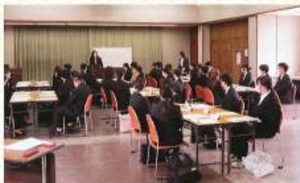
“何のために”仕事に取り組むのかの認識を 研修中