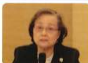
滝澤親睦委員長挨拶