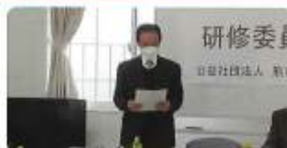
熊谷税務署山口統括官ご挨拶