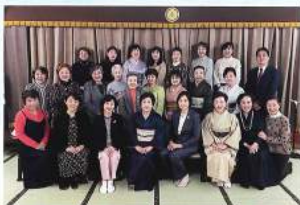
女性部会 新春懇談会 (会場：新奈)

2月10日(土)に、当支部女性部会の新春懇談会を開催しました。コロナ禍後の初の懇談会でしたが、数多くの女性部会員が集まりました。当会の現状を確認後に、ビンゴゲームで楽しいひと時を過ごしました。