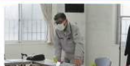
市川副委員長閉会挨拶