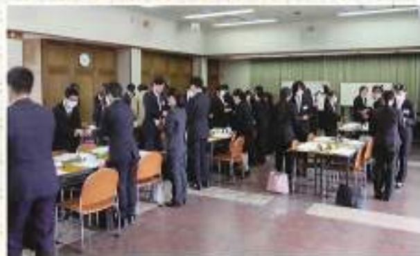
名刺の扱い方、応接・マナーの講義