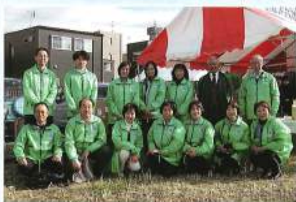
地域社会貢献活動 (会場：第18回深谷市産業祭会場内)

11月11日(土)に、深谷市産業祭において会場内で、熊谷法人会のジャンパーを着て「税の啓蒙活動」を実施しました。熊谷税務署幹部の方々にもご参加いただきありがとうございました。