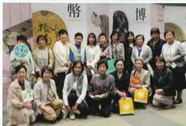
女性部会 県外研修会

10月17日(火)に、女性部会の親睦を深めることと研修を目的に視察研修会を実施しました。視察先としては、令和6年7月3日新紙幣発行にあたり東京の「貨幣博物館」・「チーム・ラボネット」と築地を散策してきました。車中では、当会の現状についてとDVD研修を実施し、有意義な県外研修でした。