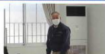
島田副委員長閉会挨拶