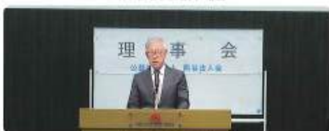
寺田副会長閉会挨拶