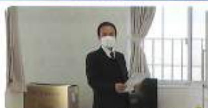
熊谷税務署山口統括官ご挨拶