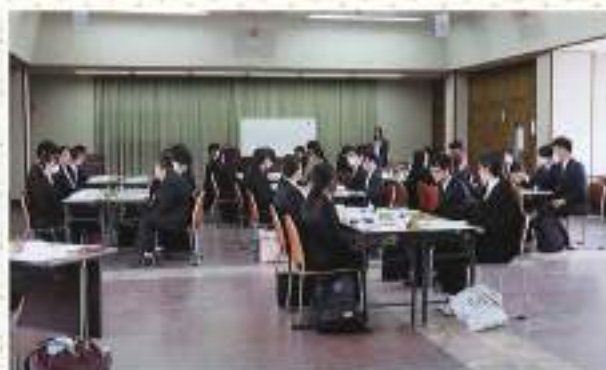
参加者同士、「お互いの情報交換」 少し緊張気味・・・