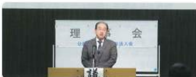
熊谷税務署税主署長ご挨拶