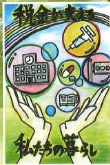
埼玉県熊谷県税事務所所長賞