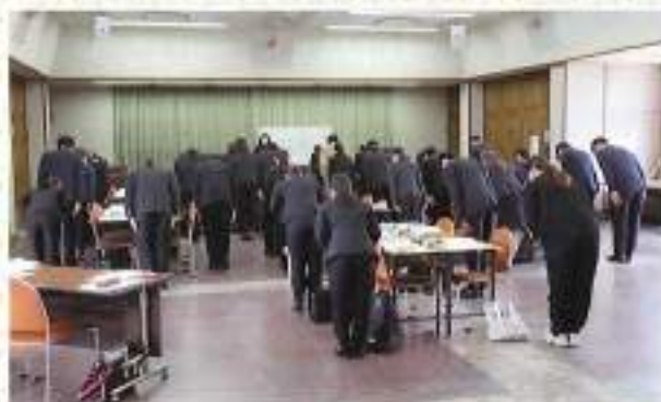
「お辞儀の基本」にチャレンジ中！